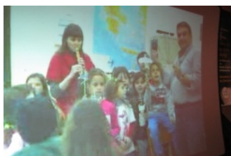
Εικόνα 3: Εισαγωγικές δραστηριότητες μαθητών

Η 1 η τηλεδιάσκεψη ξεκινά με εισαγωγικούς χαιρετισμούς, καλωσόρισμα κλπ. Αμέσως μετά οι μαθητές με τη βοήθεια του Power Point παρουσιάζουν τις ενότητες (ΠΟΛΗ-ΣΧΟΛΕΙΟ-ΤΑΞΗ) και ακολουθούν οι πρώτες διευκρινιστικές ερωτήσεις (εικόνα 3).