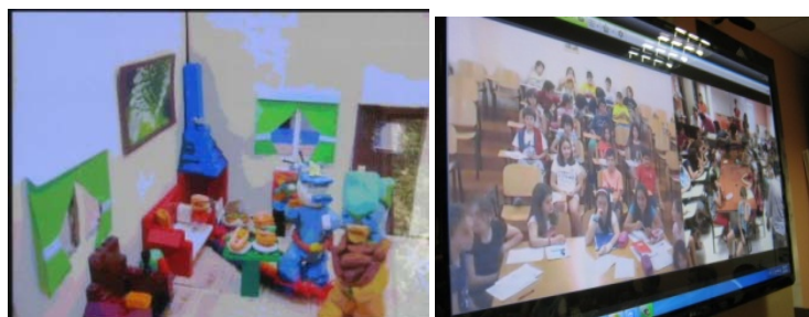
Εικόνα 2. Παρουσίαση εργασιών των μαθητών

-κάθε ομάδα αναλαμβάνει να παρουσιάσει τη δική της θεματική ενότητα. Η παρουσίαση γίνεται με animation (εικόνα 2)