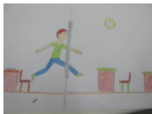
Εικόνα 6: Η απεικόνιση των συναισθημάτων ενός μαθητή σχετικά με τις τηλεδιάσκεψεις

ψυχολογικό κλίμα της τάξης. Στην τελετή λήξης των σχολείων απονεμήθηκαν στους μαθητές των δύο σχολείων που πήραν μέρος στις τηλεδιασκέψεις, έπαινοι ως ενθύμιο.