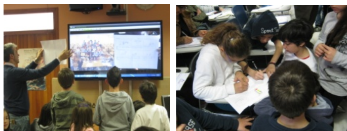
Εικόνα 1. Συνεργασία τοπικής και απομακρυσμένης τάξης

-τα παιδιά της απομακρυσμένης ομάδας προσπαθούν σε πρότυπα εικονογραφημένων σεναρίων σε φύλλα Α3 να σχεδιάσουν το σενάριο που είχε ήδη αναφέρει η αντίστοιχη ομάδα της άλλης τάξης. Δείχνουν το δικό τους εικονογραφημένο σενάριο και γίνεται αντιπαραβολή και συζήτηση με το έτοιμο εικονογραφημένο σενάριο της αντίστοιχης ομάδας (εικόνα 1).