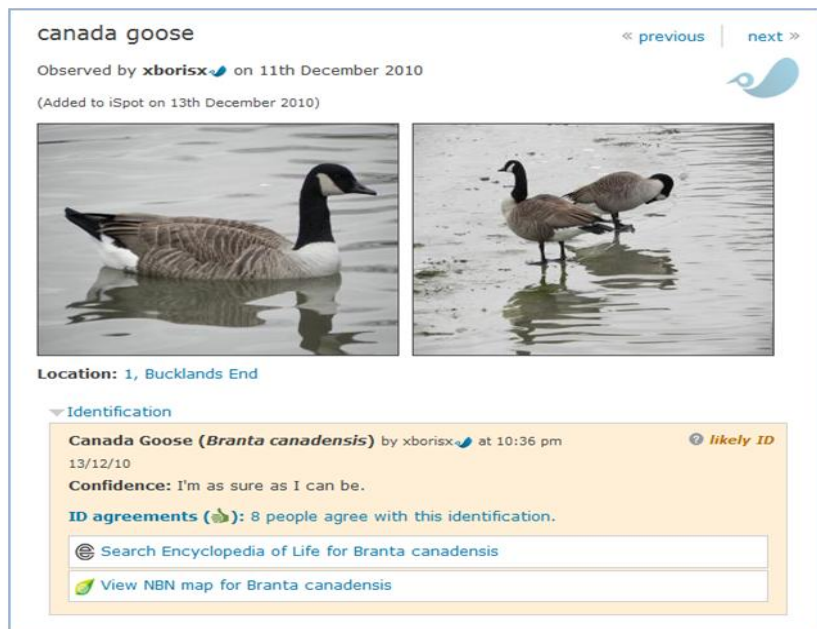
Εικόνα 2: Διαμοιρασμός φωτογραφικού υλικού από εκπαιδευόμενο και έλεγχος εγκυρότητας από την κοινότητα

Για τη διασφάλιση της ποιότητας και της εγκυρότητας του περιεχομένου, πολυμελής επιστημονική ομάδα του Ανοικτού Πανεπιστημίου παρακολουθεί την εισαγωγή νέων δεδομένων στην ιστοσελίδα, ελέγχει και διορθώνει ανάλογα. Όπως φαίνεται και από την ακόλουθη εικόνα, ο χρήστης ανεβάζει στην ιστοσελίδα τη φωτογραφία που επιθυμεί, δηλώνοντας παράλληλα την ονομασία του εικονιζόμενου είδους.