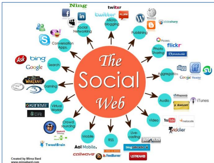
Σχήμα 1: Κατηγορίες μέσων κοινωνικής δικτύωσης κατά Bard

Με αφορμή αυτή την κατηγοριοποίηση και λαμβάνοντας υπόψη ότι υπάρχουν 1,2 εκατομμύρια ανακοινώσεις σε ιστολόγια (blogs, micro blogs κλπ.) ενώ κάθε μέρα το 45% των ενήλικων χρηστών του διαδικτύου δημιουργεί κάποιο δικό του «προϊόν» στο διαδίκτυο, ο χώρος των μέσων κοινωνικής δικτύωσης είναι ένα δυναμικά και ταχύτατα αναπτυσσόμενο πεδίο, ιδιαίτερα ελκυστικό και για τις επιχειρήσεις, καθώς ανοίγει νέες πολύπλευρες δυνατότητες για τους καταναλωτές και αλλάζει το χάρτη της αγοράς.